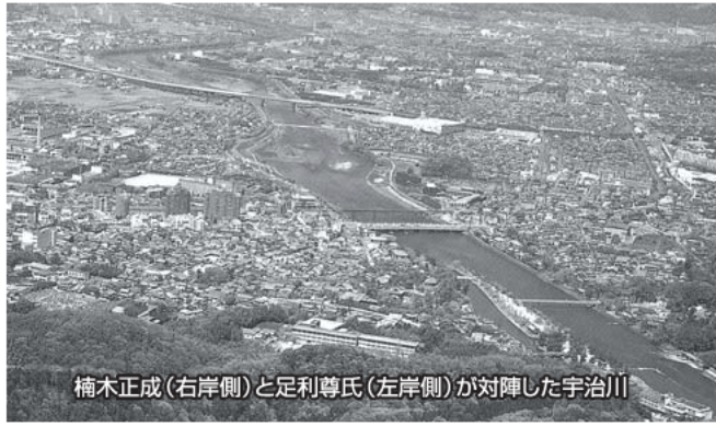
楠木正成(右岸側)と足利尊氏(左岸側)が対陣した宇治川

明け暮れていた。両派は互いに他方を庄倒しようと呼び集めに奔走したが、宮様に呼応して蜂起した播磨の赤松も恩賞の不満から足利方に走り、また宮様とともに戦った楠木さえも乱世に戻るのを恐れて中立の立場をとったので、宮様は次第に孤立無援となられた。