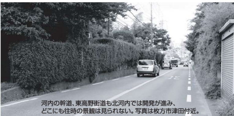
河内の幹道、東高野街道も北河内では開発が進み、どこにも往時の景観は見られない。写真は枚方市津田付近。

その頃、足利尊氏は十万に膨れあがった兵を率いて鈴鹿を越え、近江に入るや瀬田から宇治川沿いに進んで、遂に京の入り口、宇治橋に到着し、川を挟んで楠木勢とにらみ合った。尊氏は正成との正面衝突を避け、平等院に火を放って、信仰に篤い正成が先ずは寺院の消火を部下に命じるのを確かめ、宇治橋を無理に渡らず、南に迂回し、淀の大渡り辺りにて兵を渡河させ、京に進駐した。この時、平等院はかろうじて鳳凰堂だけが消失を免れるという有様であったという。