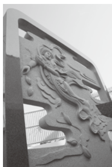
涅槃陵宝塔の後ろに立てられた、「飛天」が彫られた石製衝立。原画は仏画家、長島真山氏による。