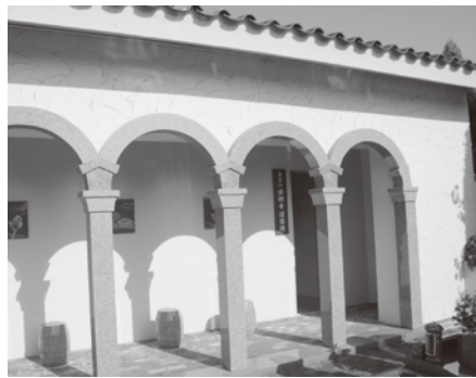
法願寺涅槃陵外観

分らないところさえありました。そこで合葬墓とはつきり謳って、遺骨を地下に作った大きな納骨室に合葬し、遺族がそこにさえ行けば、お墓の様に故人の墓参ができるようにしようという風潮が出て来たのでしよう。