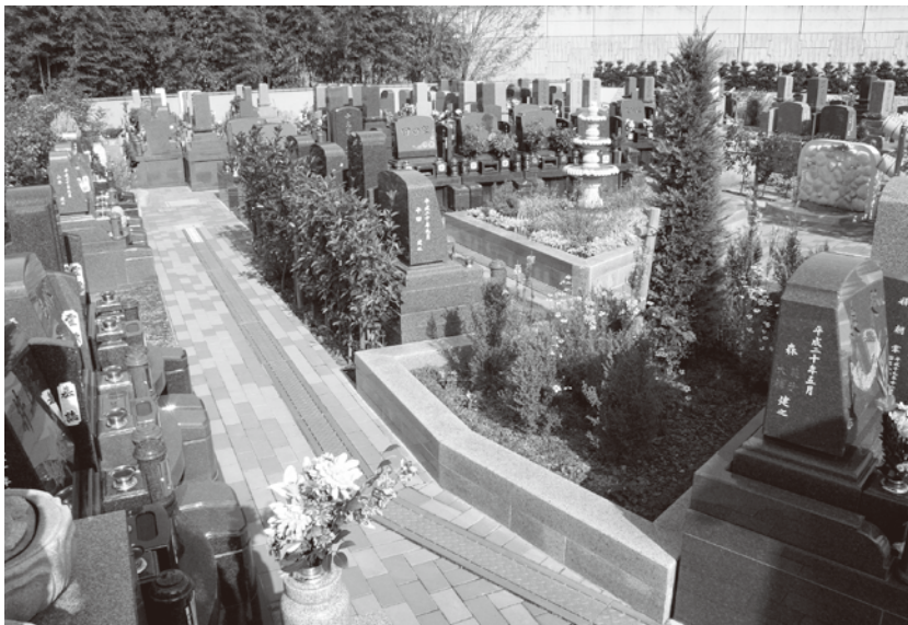
墓地の使用が進む美原東の第二期工事ゾーン

ただ美原東で墓地を購入されたお客様にお断りしなければならぬのは、今回の造成では往來の邪魔になる為、今の事務所は撤去する代わり、入り口付近に二層新事務所を建てますが、それは現在の事務所よりは中が広く外から使用できるトイレは付いてはいますが、まだそれは平屋の小さな管理事務所であつて、早くから建築をお約束していましたが、中に休憩室や法要施設がある本格的な鉄筋コンクリート建ての管理棟は、今回の第二期造成工事が竣工した後の建築申請と