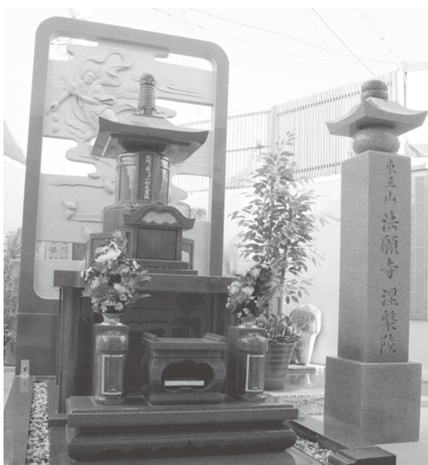
「法願寺涅槃陵」この地下に合葬する。雨天でも雨に濡れずに納骨式・参拝ができる。

前回の霊園新聞で、冠婚葬祭互助会セルビス様が美原ロイヤルメモリアルパークの玄関の横に、お堂タイプの合葬永代供養墓「アマラ」を建てられたニュースをお伝えしましたが、当霊園でもウエストゾーンの奥のほともとは無縁石碑を供養していた場所に、同じく合葬式の永代供養墓として、松原市天美我堂の高野山真言宗東山法願寺様と提携し、「法願寺涅槃陵」を設けることになりました。