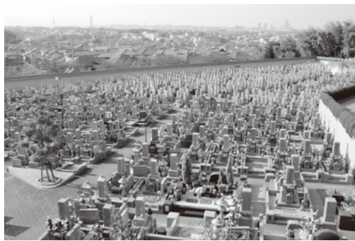
後二百数十区画を残すのみの美原ロイヤル

まだ行政から許可も戴かない段階で、拡張霊園のことをいろいろ申し上げるのには差し障りがあるでしょうが、ほんの少しだけをお話いたしますと、それは非常に自然味が豊かな霊園で、中央をまっすぐにメインストリートが伸び、その左右にはコニファーの並木が並ぶためお墓は見えず、奥にはグレコローマン(古代ギリシャ・ローマ風)の列柱が並ぶ白亜の神殿が聳え入り口の両サイドには花壇が並び、その中に洋墓が並びます。そこに足を踏み入れるだけで心が癒やされる霊園となるでしょう。