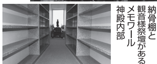
納骨棚と観音様祭壇があるメモリアル神殿内部