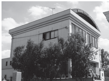
太陽光パネルを設置する管理棟

安全且つ経済的だとの定評があった原子力発電も、福島第一原発の事故以来、その安全性に疑問符が