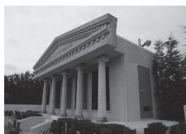
メモリアル神殿外観

このような永代供養墓の使用が急増しているのが、最近の傾向のようです。葬儀社サービスが建つ「建物のお墓」と言ったら良いのでしょうか、永代供養墓「アマラ」の使用も、その後急ピッチで増加し、最初の募集から一年半が経過して今使用者が二百名に迫っています。